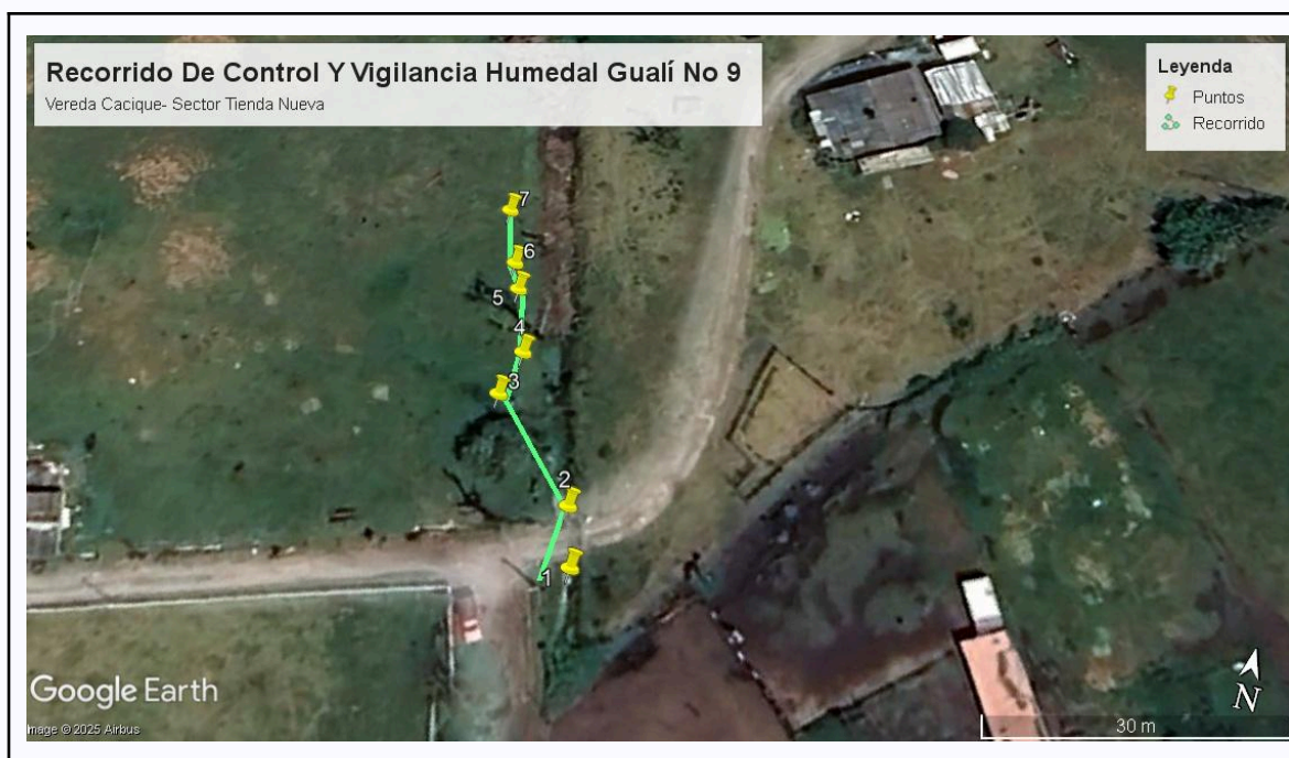
Ilustración 1. Recorrido De Control Y vigilancia Ronda Del Humedal Gualí N°9

Con base en lo anterior, el día 01 de Julio se realizó recorrido de control y vigilancia en el humedal Gualí desde las coordenadas 4°47'20.124"N y 74°13'3.66"O hasta las coordenadas 4°47'21.432"N y 74°13'4.284"O (ver ilustración 1. Ruta verde) vereda El Cacique, ecosistema que fue declarado por la Corporación Autónoma Regional de Cundinamarca - CAR como Distrito Regional de Manejo Integrado a través del acuerdo 001 de 2014 "Por medio del cual se declaran como Distrito Regional de Manejo Integrado (DMI), los terrenos comprendidos por los humedales de Gualí, Tres Esquinas y Lagunas de Funzhé, y su área de influencia directa ubicada en los municipios de Funza, Mosquera y Tenjo, Cundinamarca", y estableció tres zonas: 1. Preservación (espejo de agua), 2. Recuperación (50 metros) y 3. Uso sostenible (100 metros)